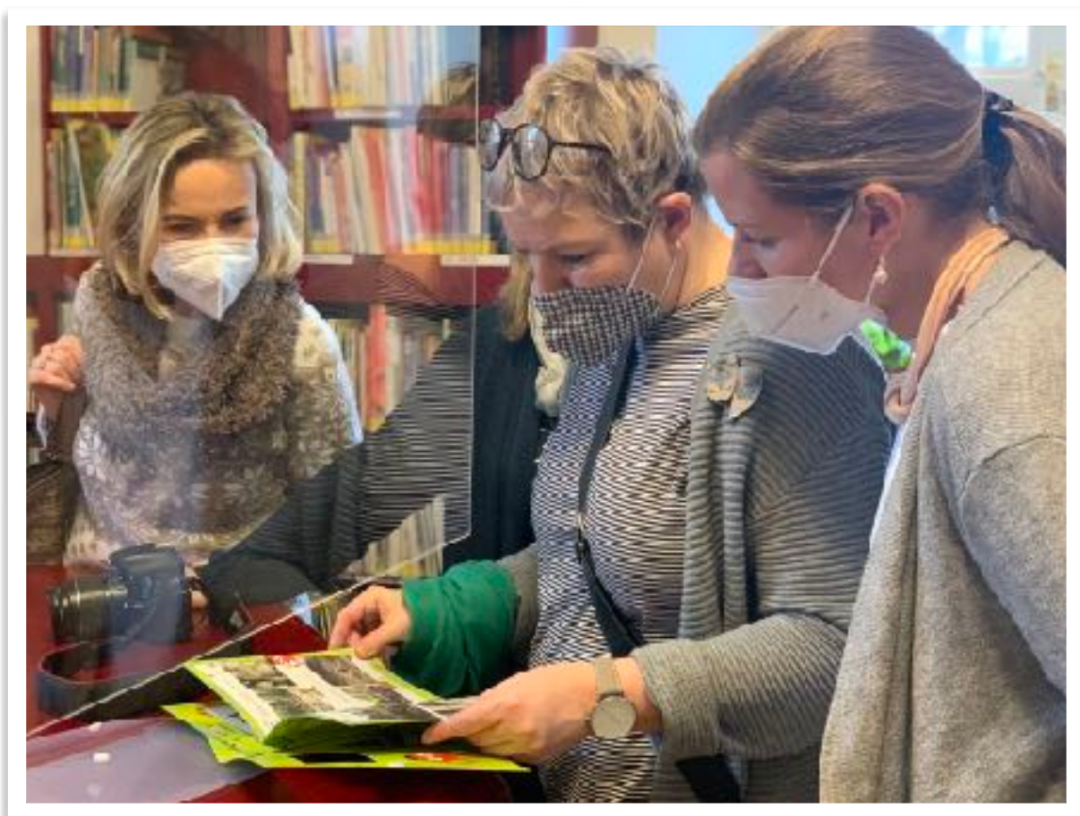
Ze slavnostního otevření dětského koutku