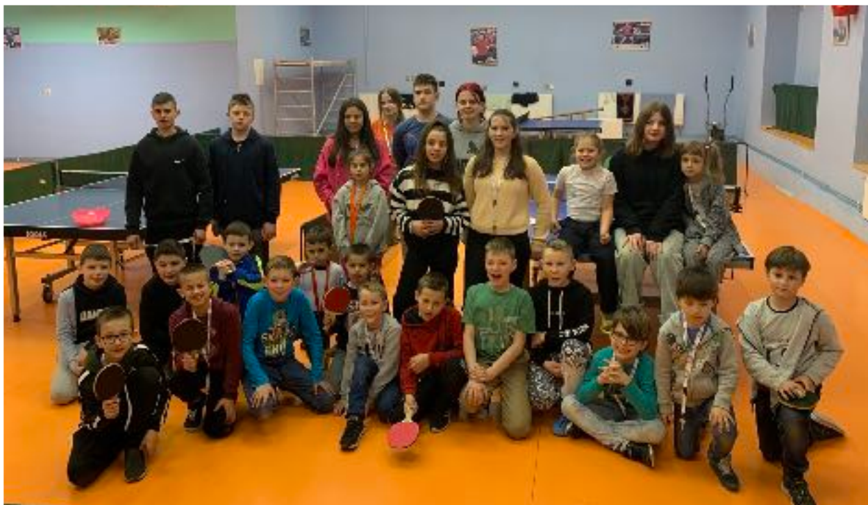
S ukrajinskými dětmi jsme jedno dopoledne strávili v herně stolního tenisu

V únoru 2022 začala válka na Ukrajině, která vytrhla statisíce Ukrajinců z běžného života a donutila je opustit jejich domovy. V rámci pomoci těm, kteří našli domov v Moravské Třebové, jsme se v březnu a dubnu starali o asi 35 ukrajinských dětí . A tak jsme s dětmi četli, hráli, poznávali město, prozkoumali muzejní sbírky, nakoukli pod pokličku psího výcviku nebo si zkusili zahrát stolní tenis. Úplně největší úspěch sklidila návštěva u moravskotřebovských hasičů.