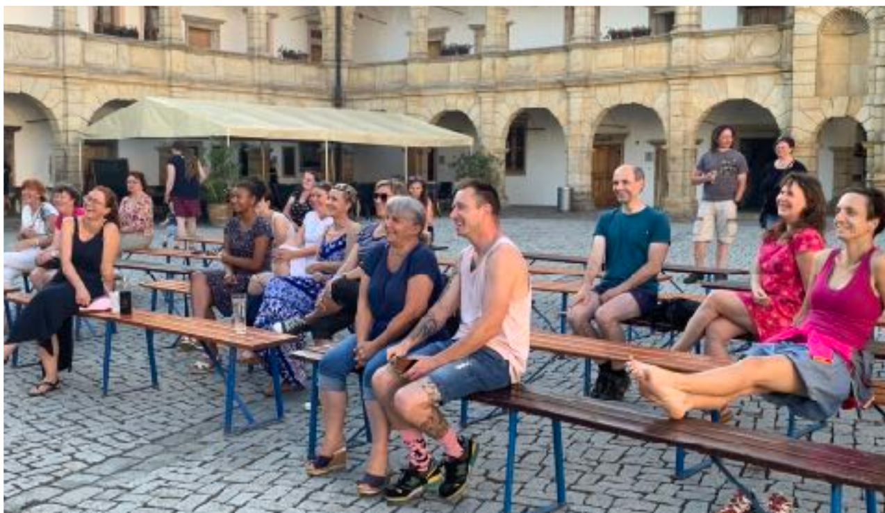
Poprvé jsme představení z cyklu LiStOVáNí uspořádali na zámku a rovnou na nádvoří

Meziročně se o 132% zvedla návštěvnost na knihovnou pořádaných akcích. To ovšem srovnáváme s covidovým rokem. Počet 9594 návštěvníků je však čtvrtý nejvyšší v historii knihovny a současně nejvyšší za posledních pět let.