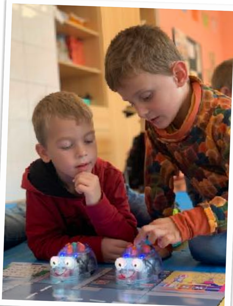
Majetek knihovny rozšířili roboti typu Bluebot

V roce 2022 nebyly uskutečněny žádné akce investičního charakteru.