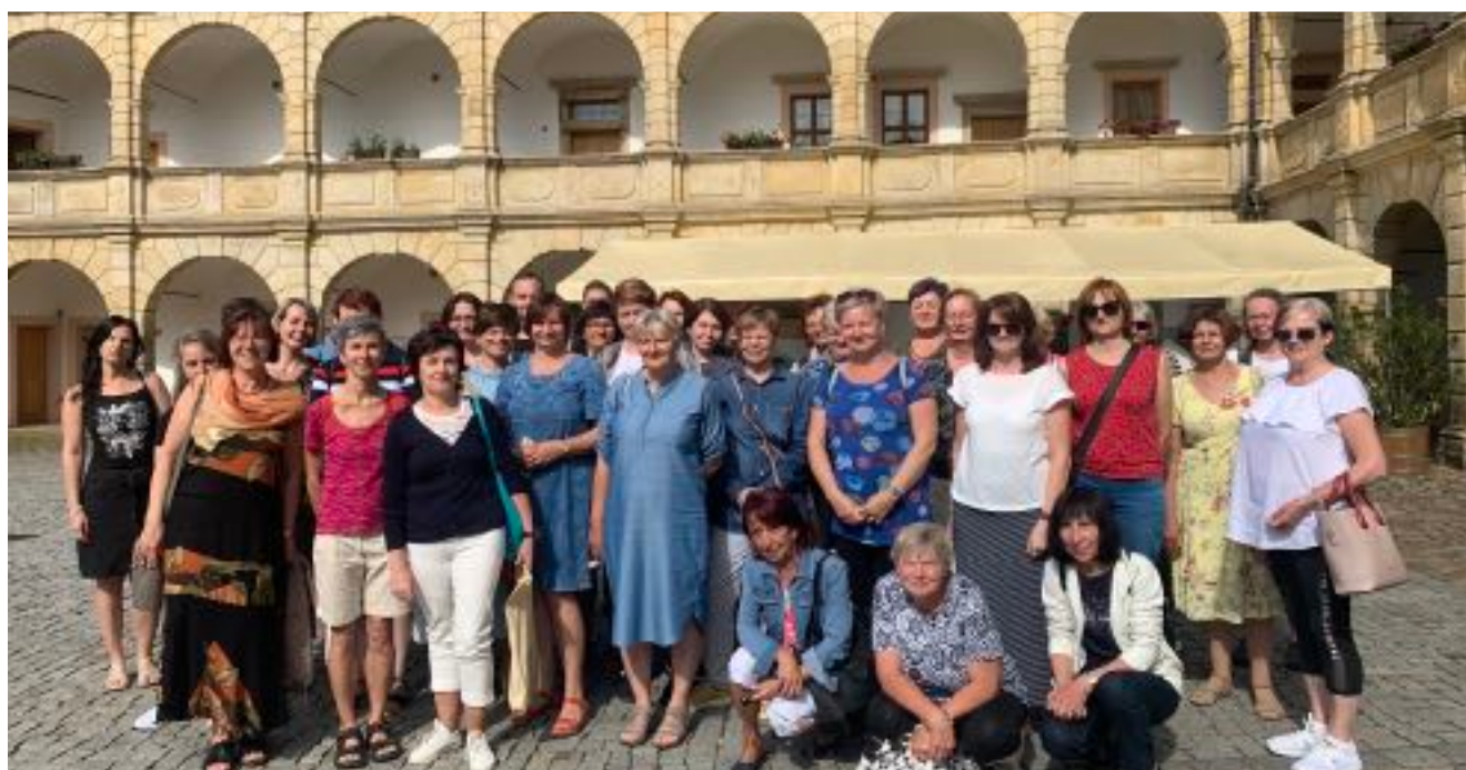
Exkurze knihovníků z Boskovicka