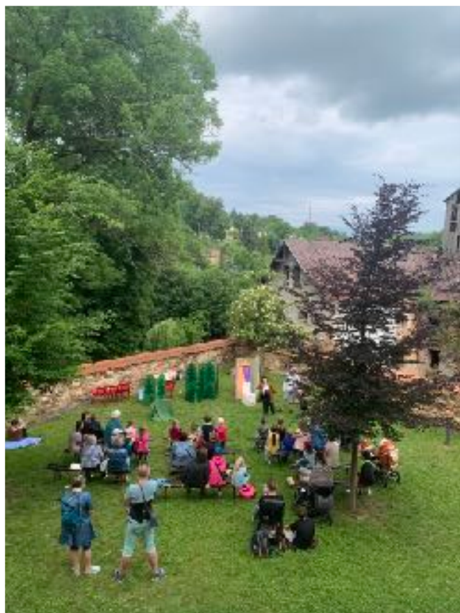
Divadelní soubor J. K. Tyla v rámci akce Pohádka na zámku hrál v zámeckých zahradách