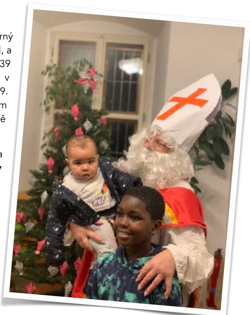
Mikuláš v knihovně

Kulturním akcím vévodí zejména trojlístek LiStOVání pro školy (pět představení pro celkem 954 diváků, které byly poprvé zcela o b s a z e n y j e n moravskotřebovskými školami), Pasování prvňáčků na čtenáře (290 dětí a jejich rodičů) a oblíbený rodinný Lampiónový průvod , kterého se zúčastnilo rekordních 481 občanů města.