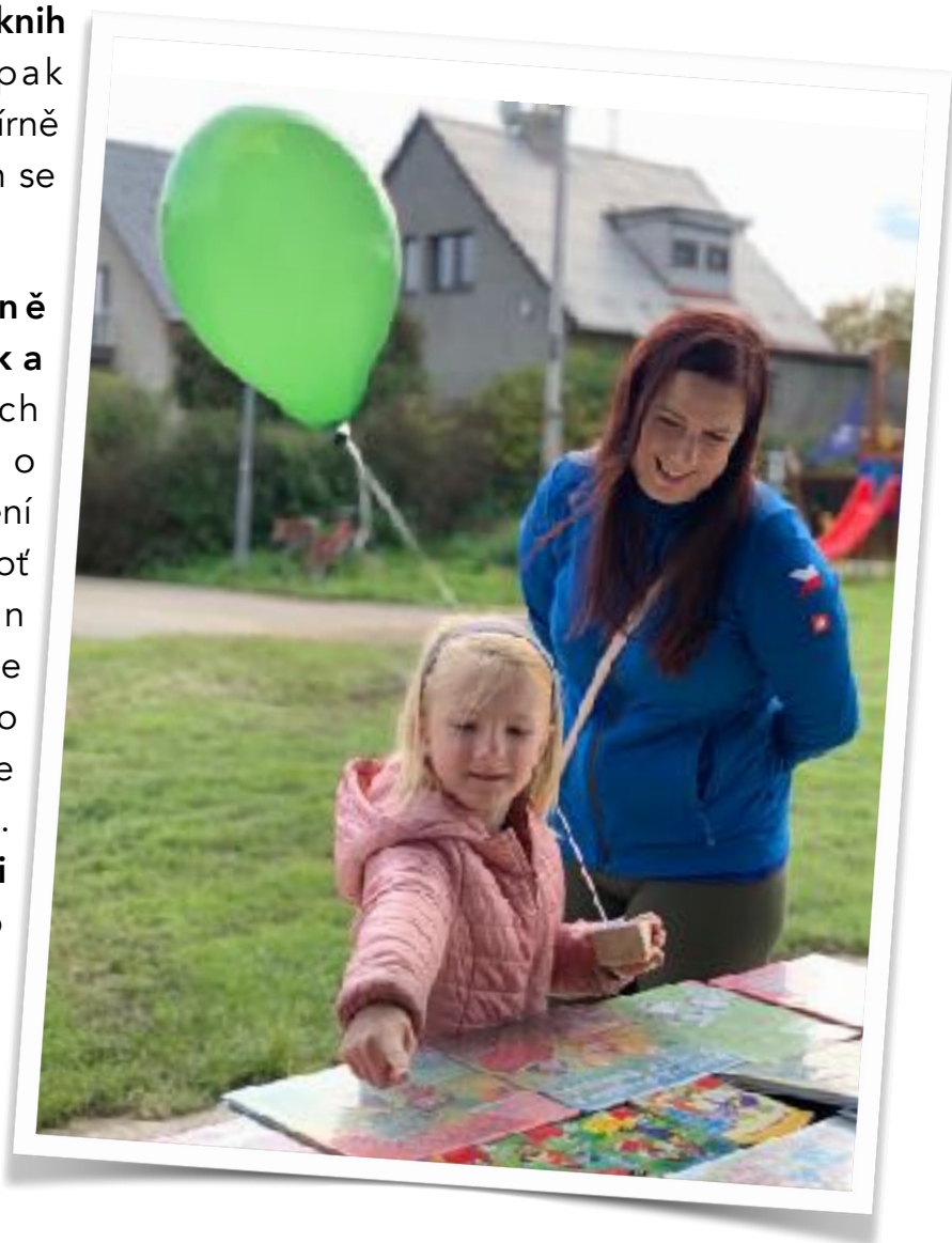
Momentka z oslavy 20 let Technických služeb

Rok 2022 byl enormně úspěšný z hlediska uspořádaných akcí , jejich počet se meziročně zvedl o 80%, což samo o sobě není zcela vypovídající číslo, neboť rok 2021 byl poznamenán pandemií covidu-19. Ale zaznamenali jsme nárůst o 27% i oproti dosud na akce nejbohatšímu roku 2019. Celkem jsme tak uspořádali 335 akcí , z čehož 261 bylo pro děti a z toho objemu bylo 180 vzdělávacích. Velký podíl na tom měly lekce robotiky.