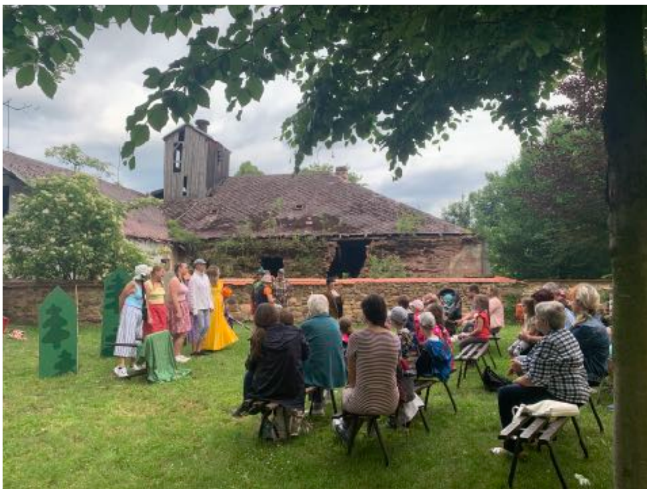
Pohádkové čtení v zámeckých zahradách

Na základě objednávky městské knihovny ve Svitavách poskytuje služby jednadvaceti obecním a místním knihovnám v regionu Moravská Třebová.